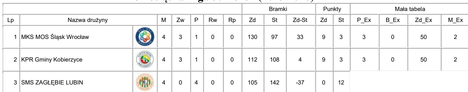
Dolnośląska Liga Juniorek (2025/2026)

M - ilość rozegranych meczów; Zw - ilość zwycięstw; P - ilość porażek; Rw - remisy wygrane; Rp - remisy przegrane; Zd - zdobyte; St - stracone